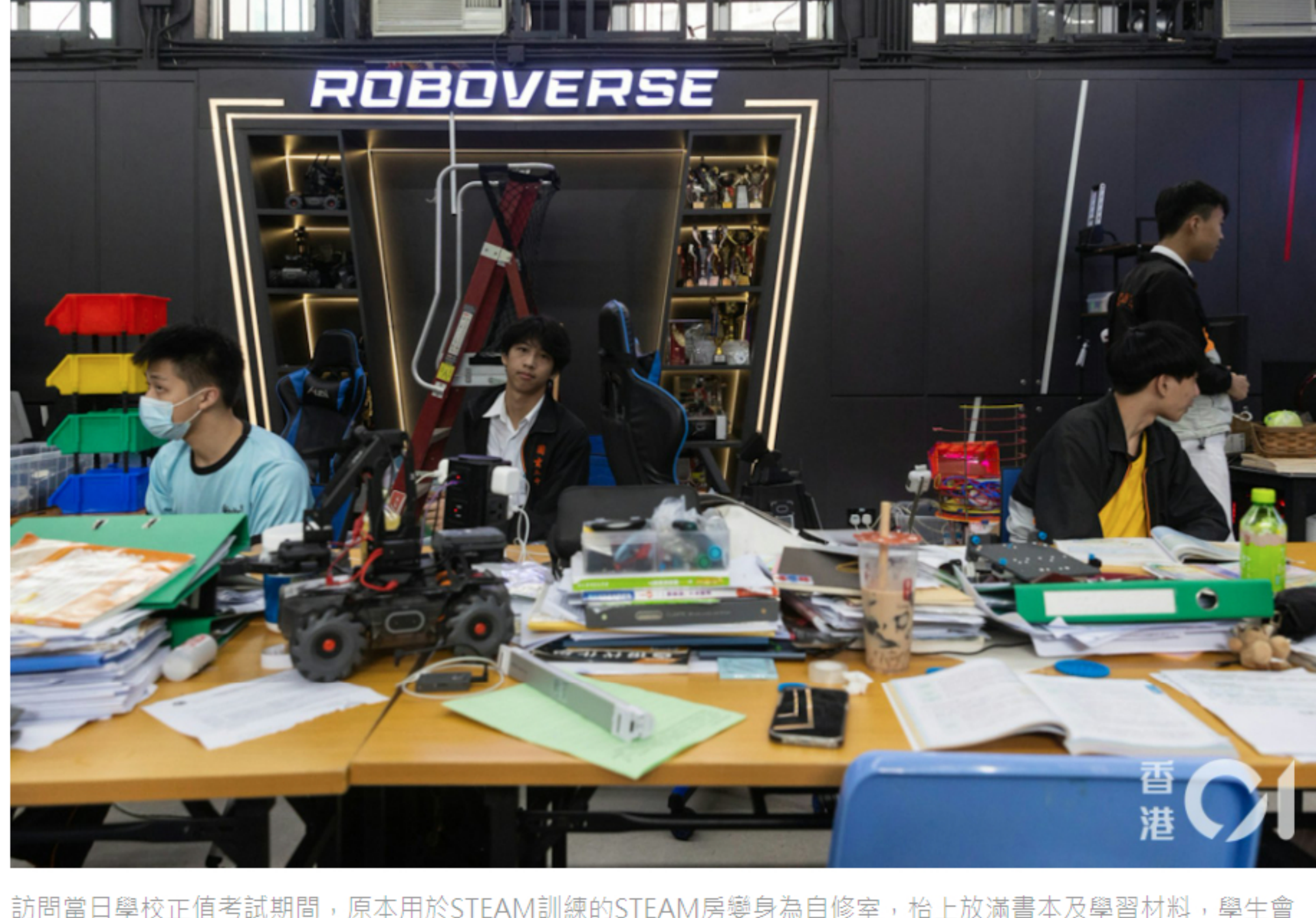
訪問當日學校正值考試期間，原本用於STEAM訓練的STEAM房變身為自修室，怕上放滿書本及學習材料，學生會一起在STEAM房溫習。