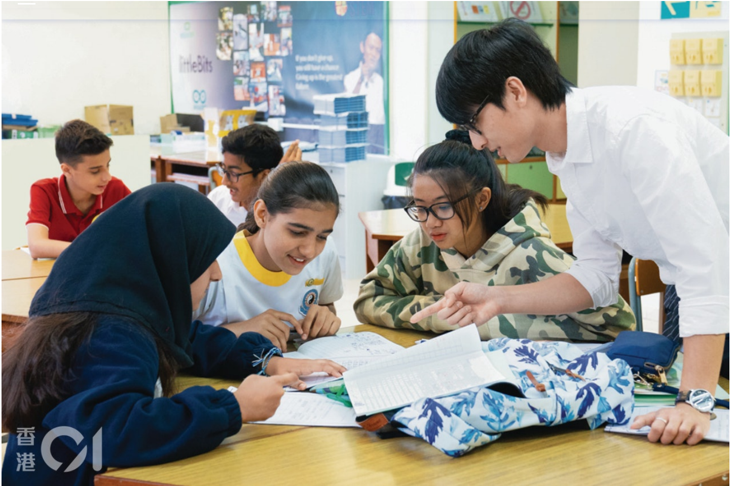
香港道教聯合會圓玄學院第三中學採用跨級按程度分班、再以小組形式授課。

「『瘦身』和『減肥』，在『瘦身』之前出現哪個字？」老師問道。「健康。」同學回答。「在『減肥』前呢？」「盲目。」「哪個是 positive？哪個是 negative？」我們走到第一個班房，同學正在上中文課，讀完文章後，學習把字詞分為「褒義」和「貶義」。老師用上不少英文解釋，讓同學理解字詞的意思。同學在生字旁邊記下的筆記各有不同，有學生寫上英文解釋，有學生寫上粵語拼音，有學生什麼也沒有寫。